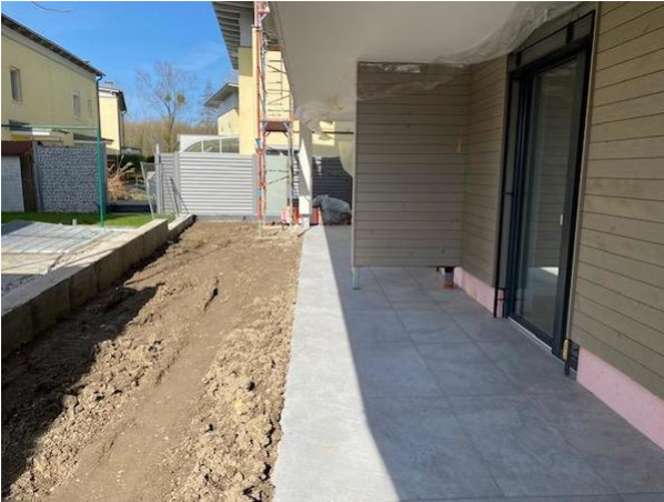
Großer Eigengarten mit Terrasse