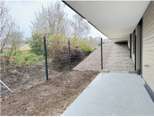
Terrasse und Eigengarten