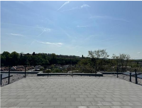
Große allgemeine Dachterrasse