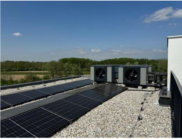
PV-Anlage und Luftwärmepumpe