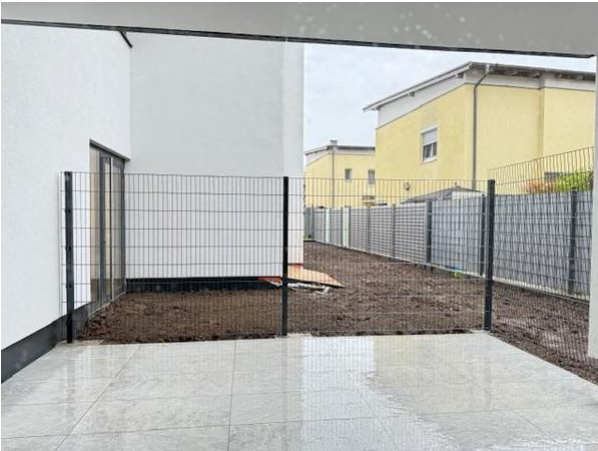
Terrasse und Eigengarten